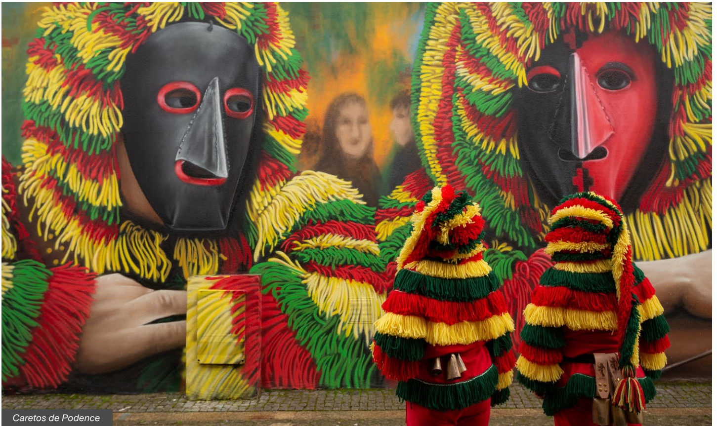
Caretos de Podence

e Coimbra; assistente acompanhante INATEL; seguro de viagem. Não inclui: taxa de reserva (10€); quaisquer serviços não mencionados.