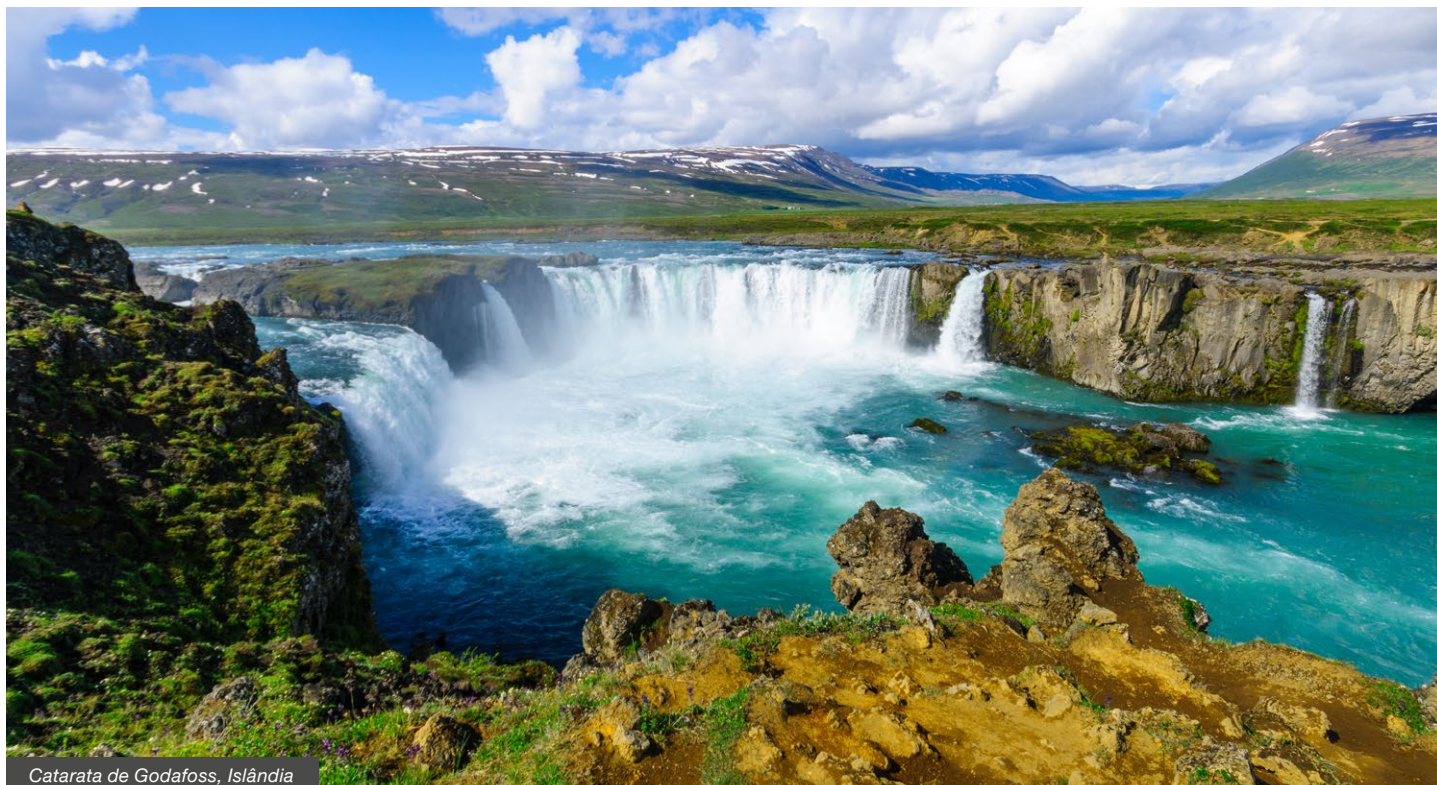
Catarata de Godafoss, Islândia

Não inclui: taxas de reserva (10€); quaisquer serviços não mencionados.