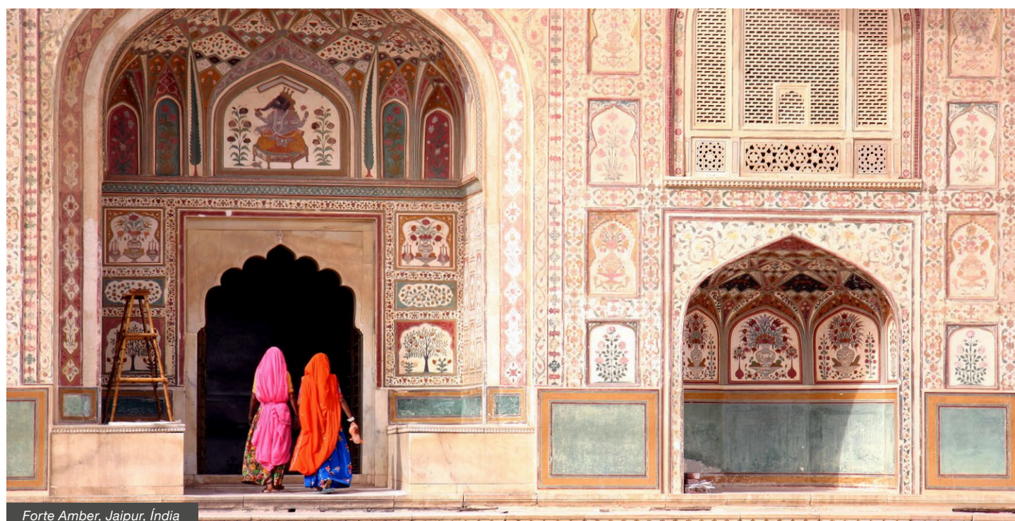
Forte Amber, Jaipur, Índia

Por pessoa em quarto duplo desde: 1.660€