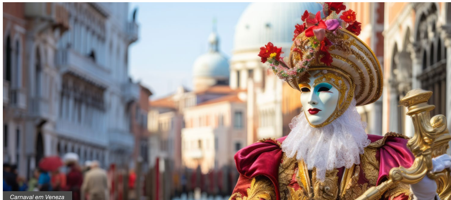
Carnaval em Veneza

Não inclui: taxa de reserva (10€); taxas de cidade (3,10€/por pessoa/noite em Veneza-Mestre e 1€/por pessoa/noite - arredores de Verona - sujeitas a alterações); suplemento de partida (do Porto: 131€, de Faro: 130€, do Funchal: 194€ e de Ponta Delgada: 176€); quaisquer serviços não mencionados.