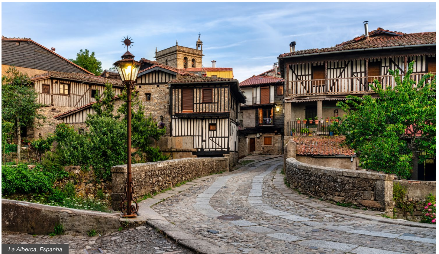
La Alberca, Espanha