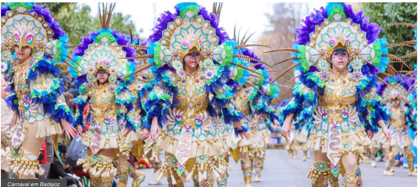
Carnaval em Badajoz

Inclui: circuito em autocarro; 3 noites de alojamento no INATEL Luso***; refeições: 2 almoços e 3 jantares, com bebidas incluídas; entradas: Carnaval em Vale de Ilhavo e Mata do Buçaco; visitas: Mata do Buçaco, Vale de Ilhavo