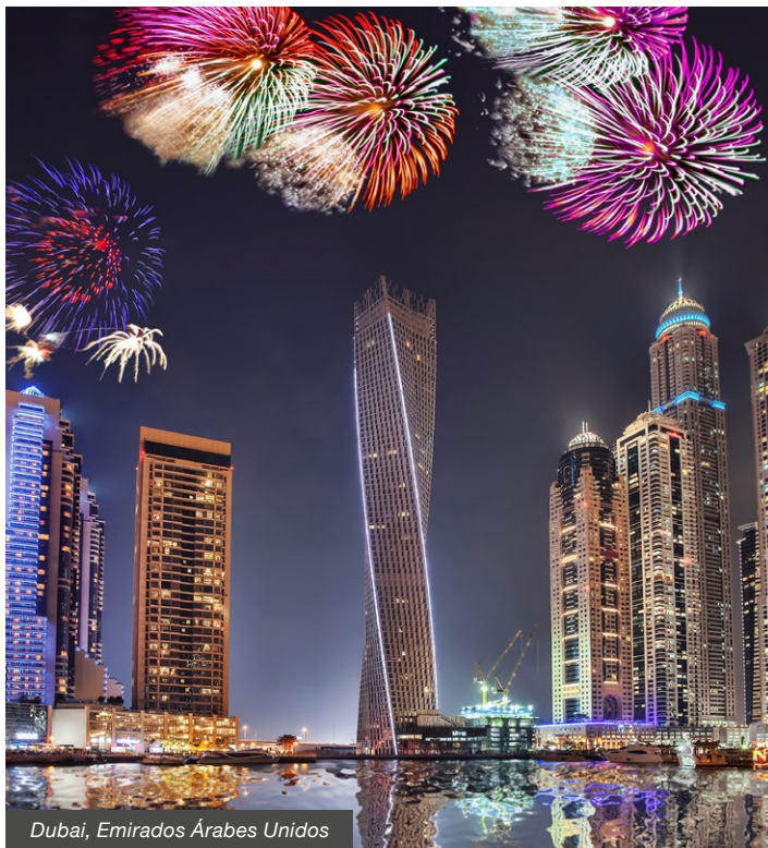
Dubai, Emirados Árabes Unidos

cachecol, meias de lã, capacete e luvas para passeio de moto de neve; presente do Pai Natal para crianças menores de 10 anos; entretenimento infantil; uso da sauna comum do resort; guia em espanhol; assistente INATEL; seguro de viagem.