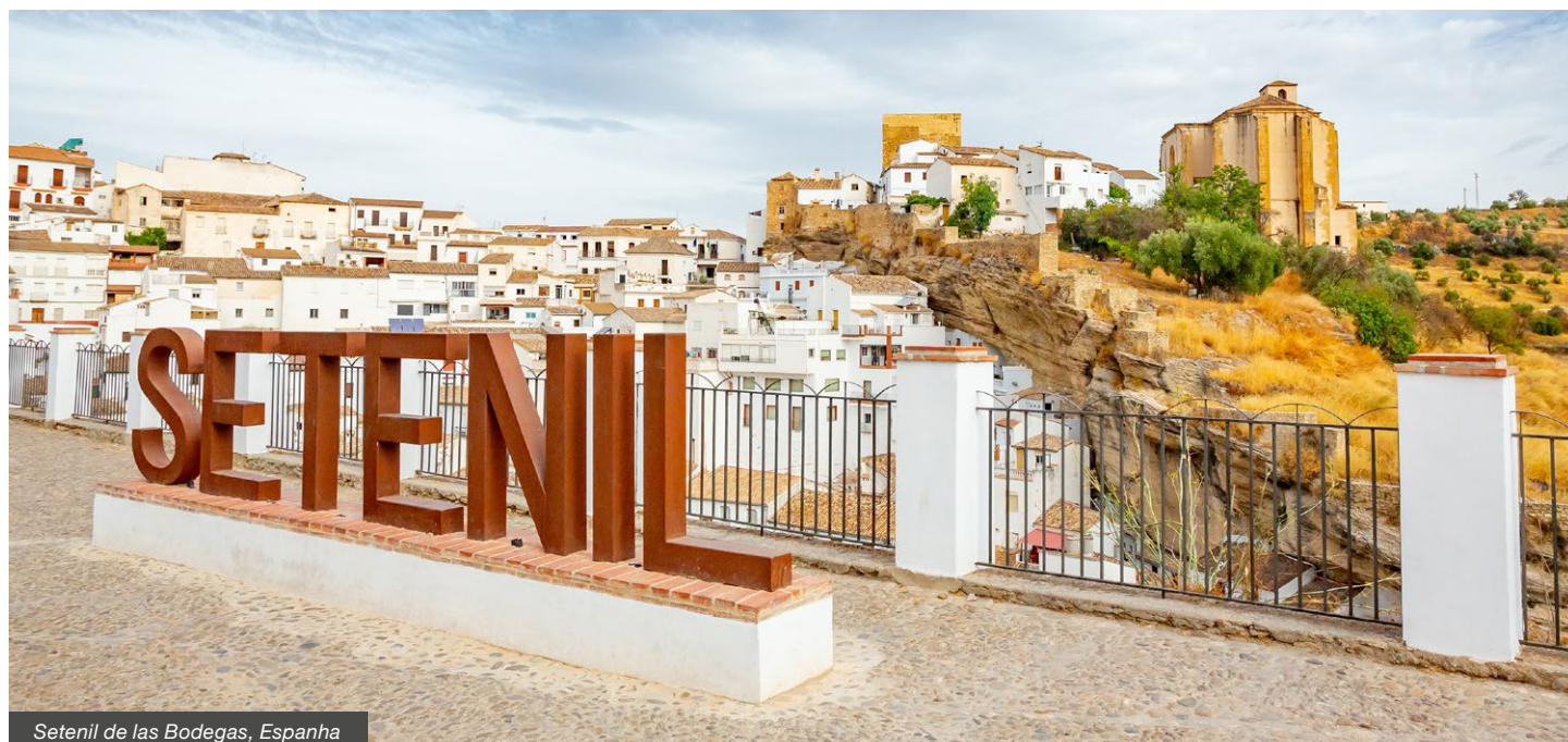
Setenil de las Bodegas, Espanha

Não inclui: taxa de reserva (10 €); quaisquer serviços não mencionados.