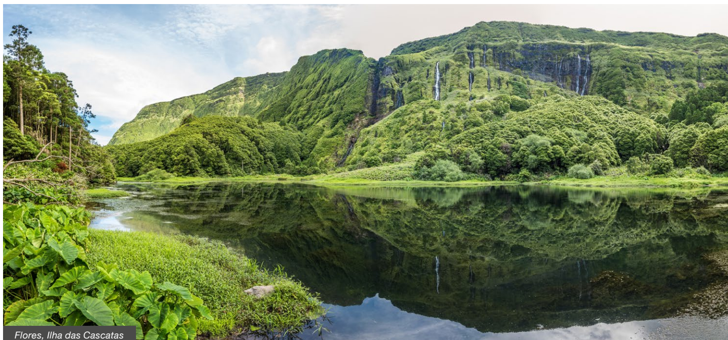
Flores, Ilha das Cascatas

Visitamos uma das mais belas ilhas do arquipélago dos Açores, Flores, a "Ilha das Cascatas", e que faz parte da Rede Mundial de Reservas da Biosfera da UNESCO. Oportunidade para visitar o Corvo, a ilha "desconhecida" e mais isolada do nosso país.