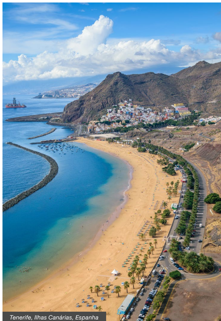
Tenerife, Ilhas Canárias, Espanha

Dubai é um dos destinos mais deslumbrantes e uma das cidades mais visitadas do mundo. Uma viagem em que poderá também vivenciar experiências sensoriais com a passagem pelos famosos souks, mercados típicos árabes. É a bordo do inovador MSC Euribia, um navio diferente e único pelo seu design inovador e um dos ecológicos mais avançados do mar que partimos para uma viagem inesquecível. Com paragens em Doha no Catar, Bahrein Património Mundial da UNESCO em pleno Golfo Pérsico, Abu Dhabi, a capital dos Emirados Árabes Unidos e na ilha Sir Bani Yas, o oásis de praia.