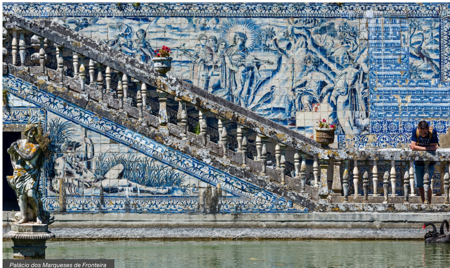
Palácio dos Marqueses de Fronteira